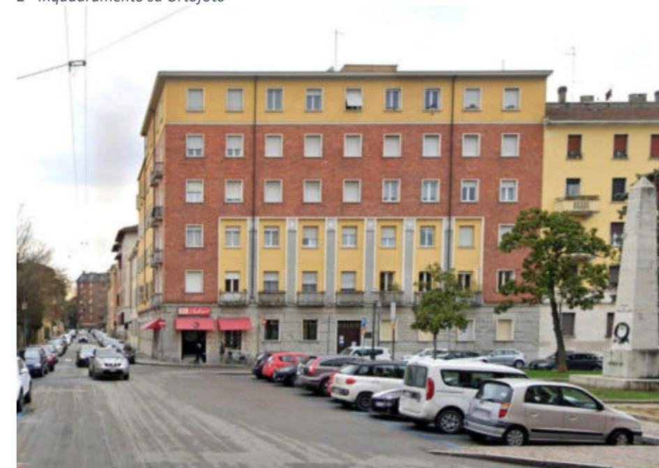
Figura 4.