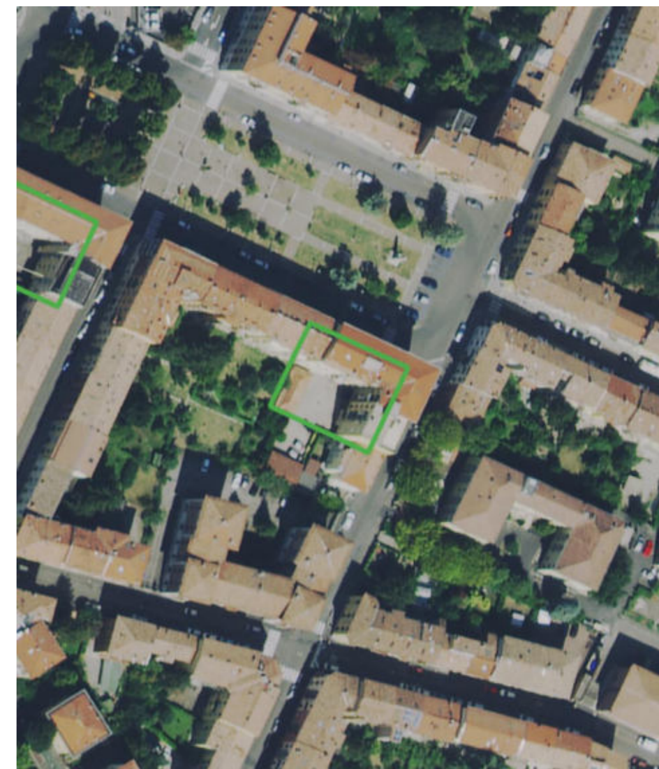
2 - Inquadramento su Ortofoto