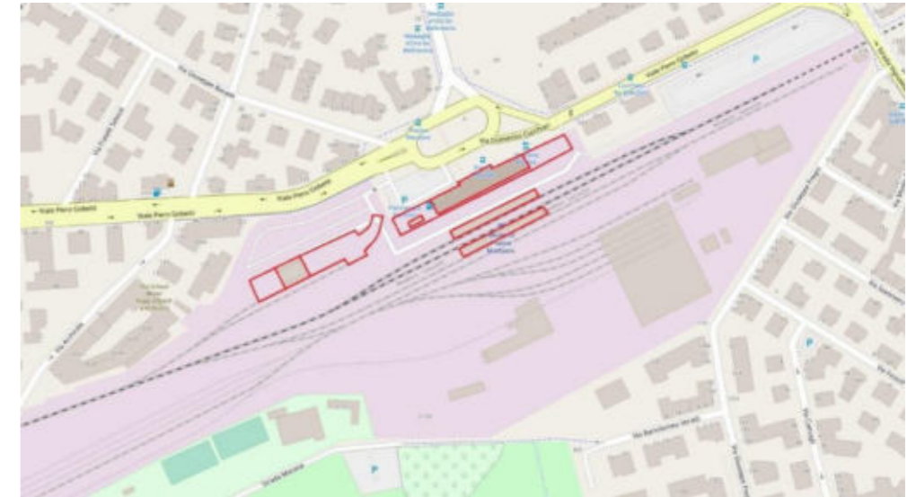
2 - Inquadramento su Ortofoto