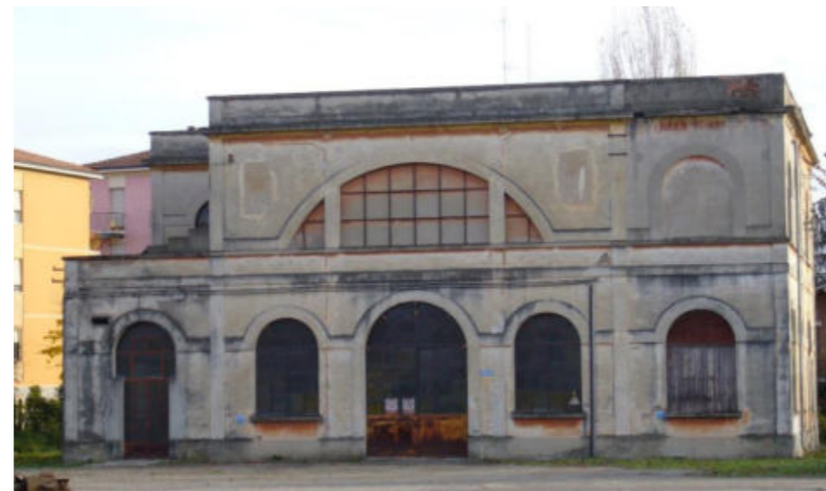
Figura 20 – Sottostazione elettrica (SSE), foglio 175, part. 205

U.E. 81 Denominazione AREA FERROVIARIA Provincia MODENA Comune MODENA Ubicazione PIAZZA ALESSANDRO MANZONI DATI CATASTALI Sezione - Foglio 175 Particella Ved. Tabella sotto Subalterno Ved. Tabella sotto Categoria Ved. Tabella sotto Classe - Superficie catastale (mq) 323 Condizione Giuridica INDISPONIBILE Valore di inventario (€) 432.359,55 € 1 Classe Energetica G Provvedimento di vincolo Soprintendenza dei Beni Culturali