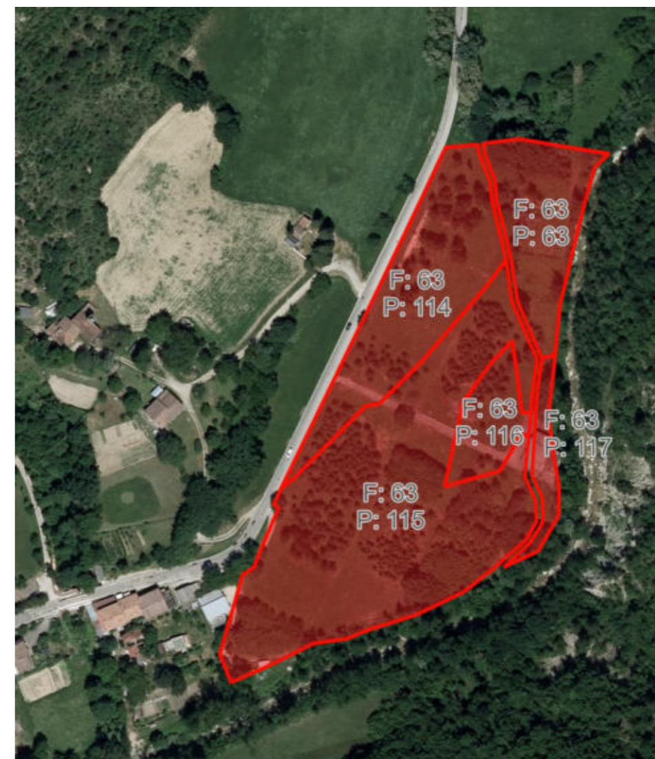
36 - Inquadramento su Ortofoto