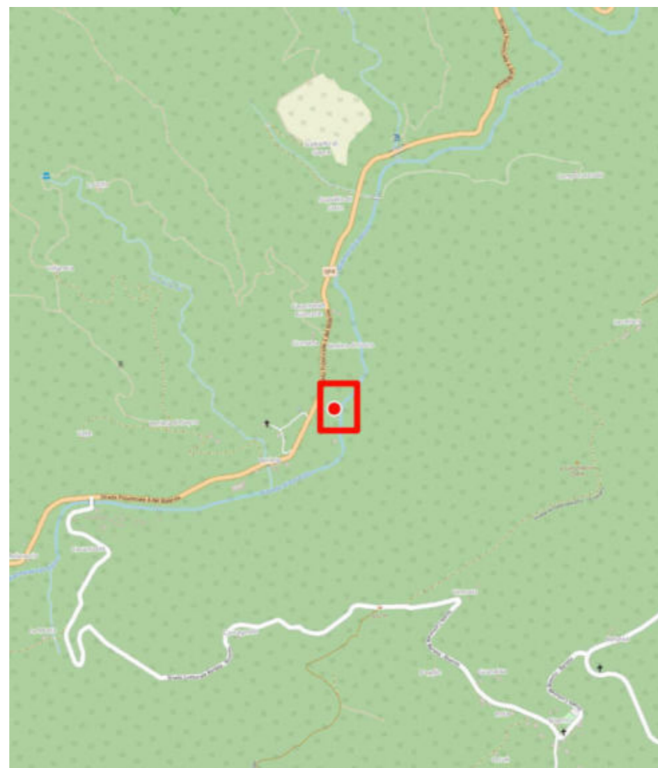
35 - Inquadramento su Open Street Map

* = valori da correggere dopo frazionamento e aggiornamento catastale