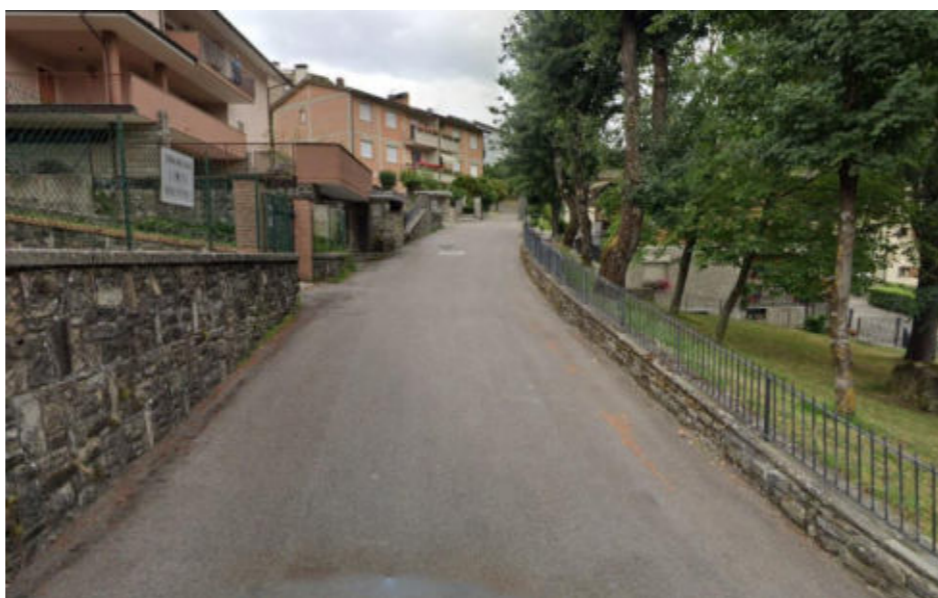
Figura 6.