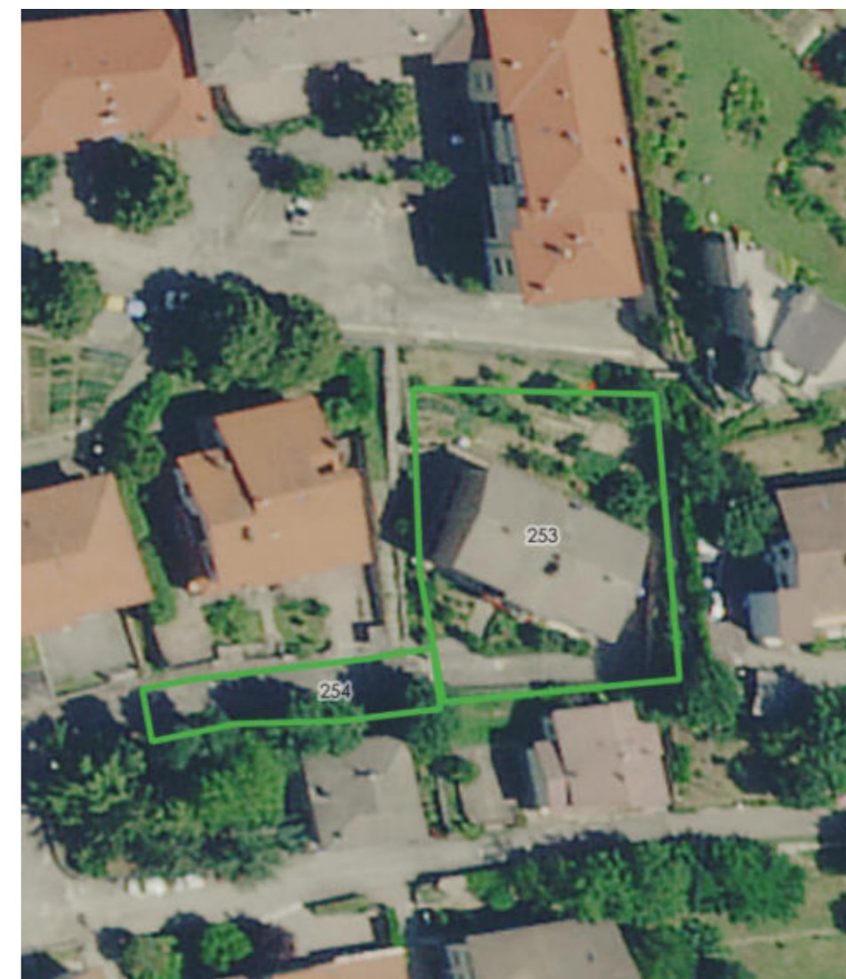
2 - Inquadramento su Foto Aerea