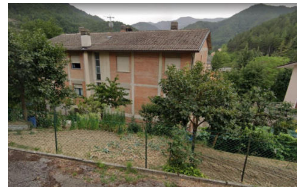
Figura 7.