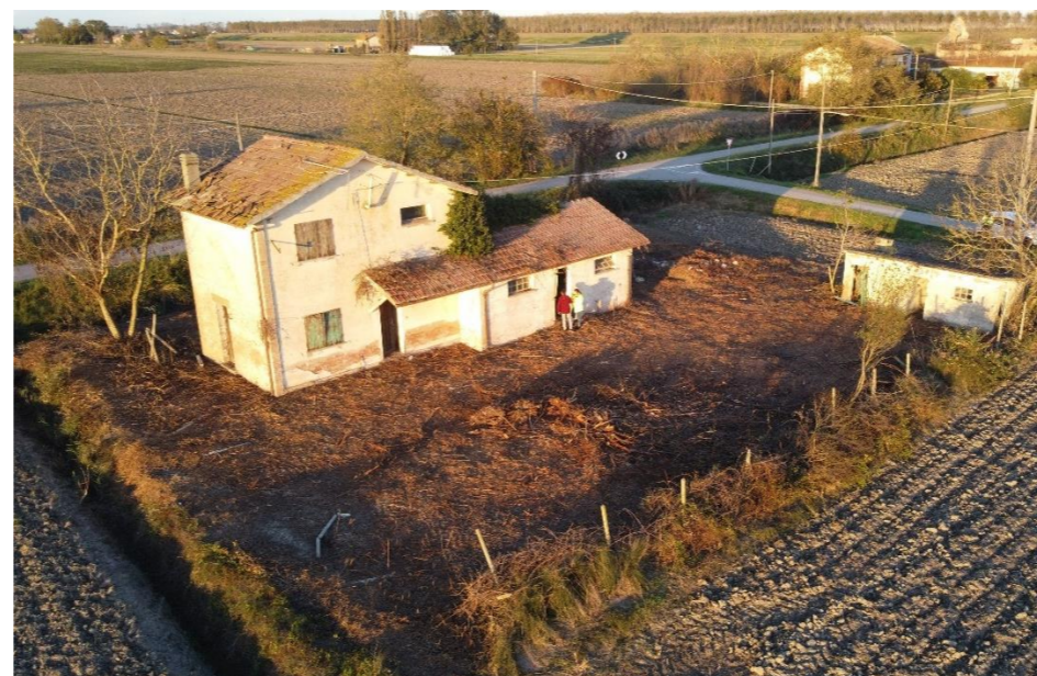
Figura 19.