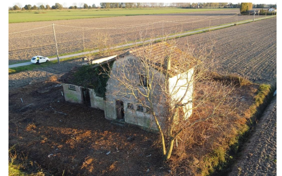
Figura 20. Foto Fonte: Regione Emilia-Romagna – Sopralluogo 2023