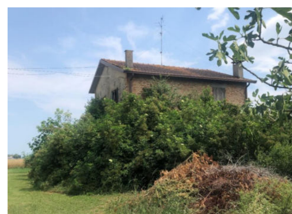
Figura 2.