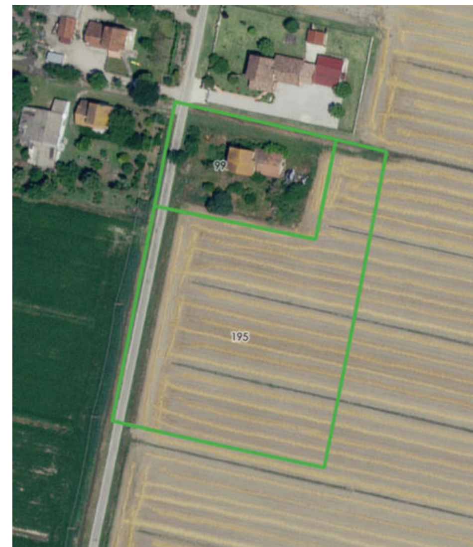
2 - Inquadramento su Foto Aerea