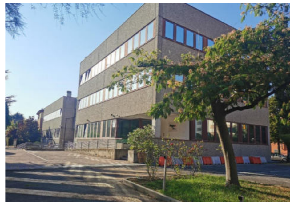
Figura 9. Foto Fonte: Regione Emilia-Romagna sopralluogo 2022