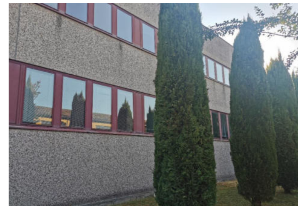
Figura 10. Foto Fonte: Regione Emilia-Romagna sopralluogo 2022