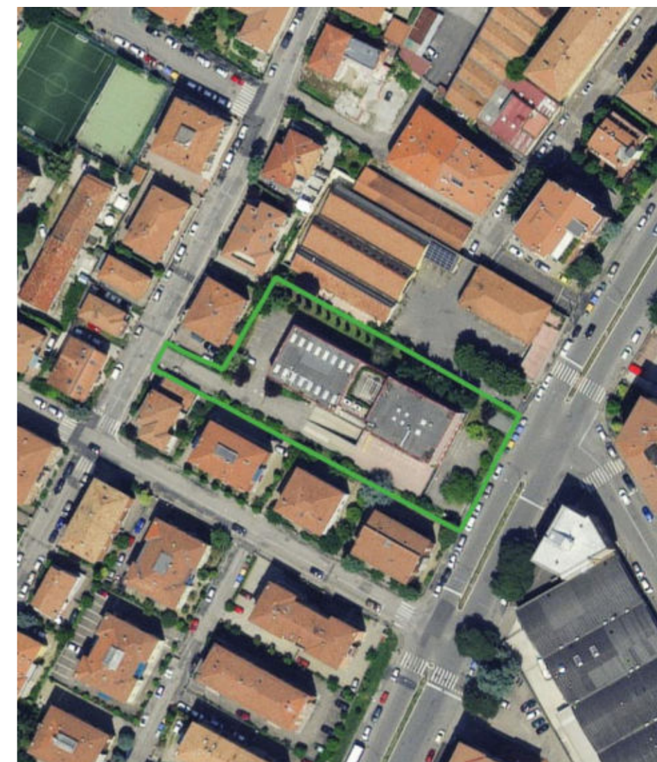
2 - Inquadramento su Foto aerea