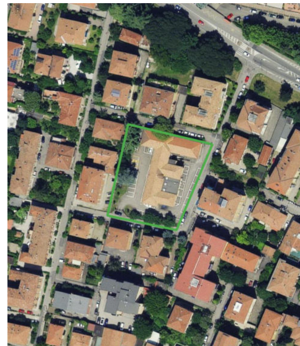
2 - Inquadramento su Foto aerea