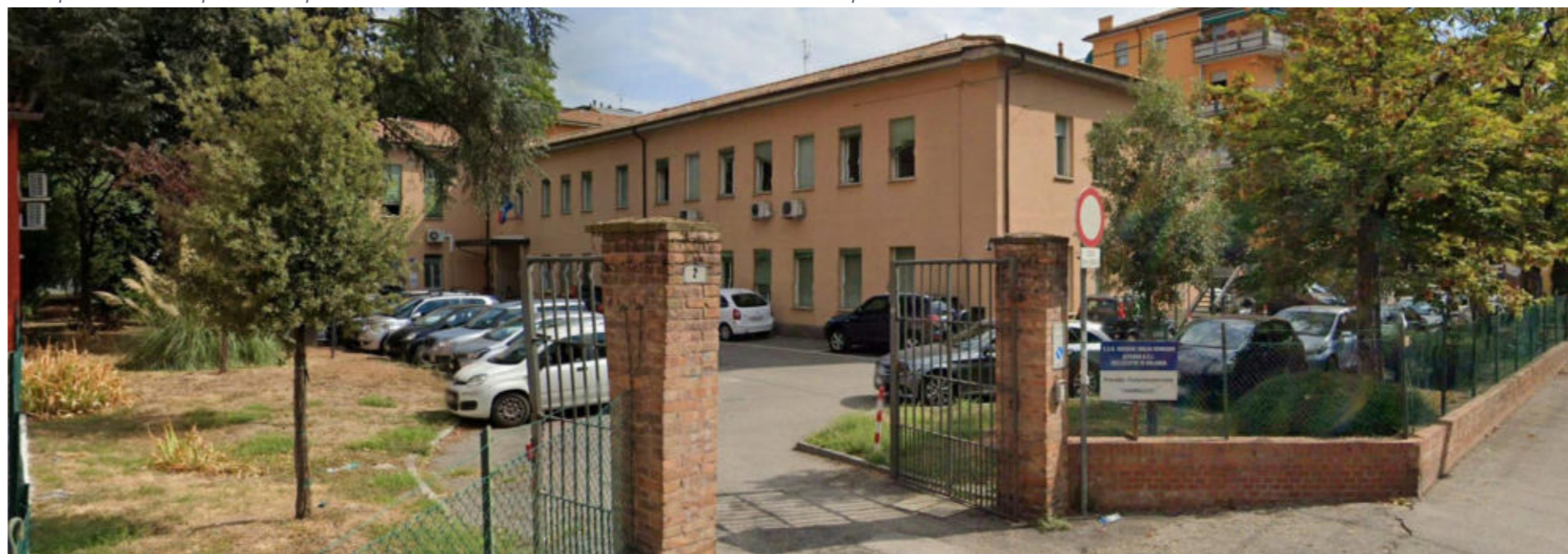
Figura 12.